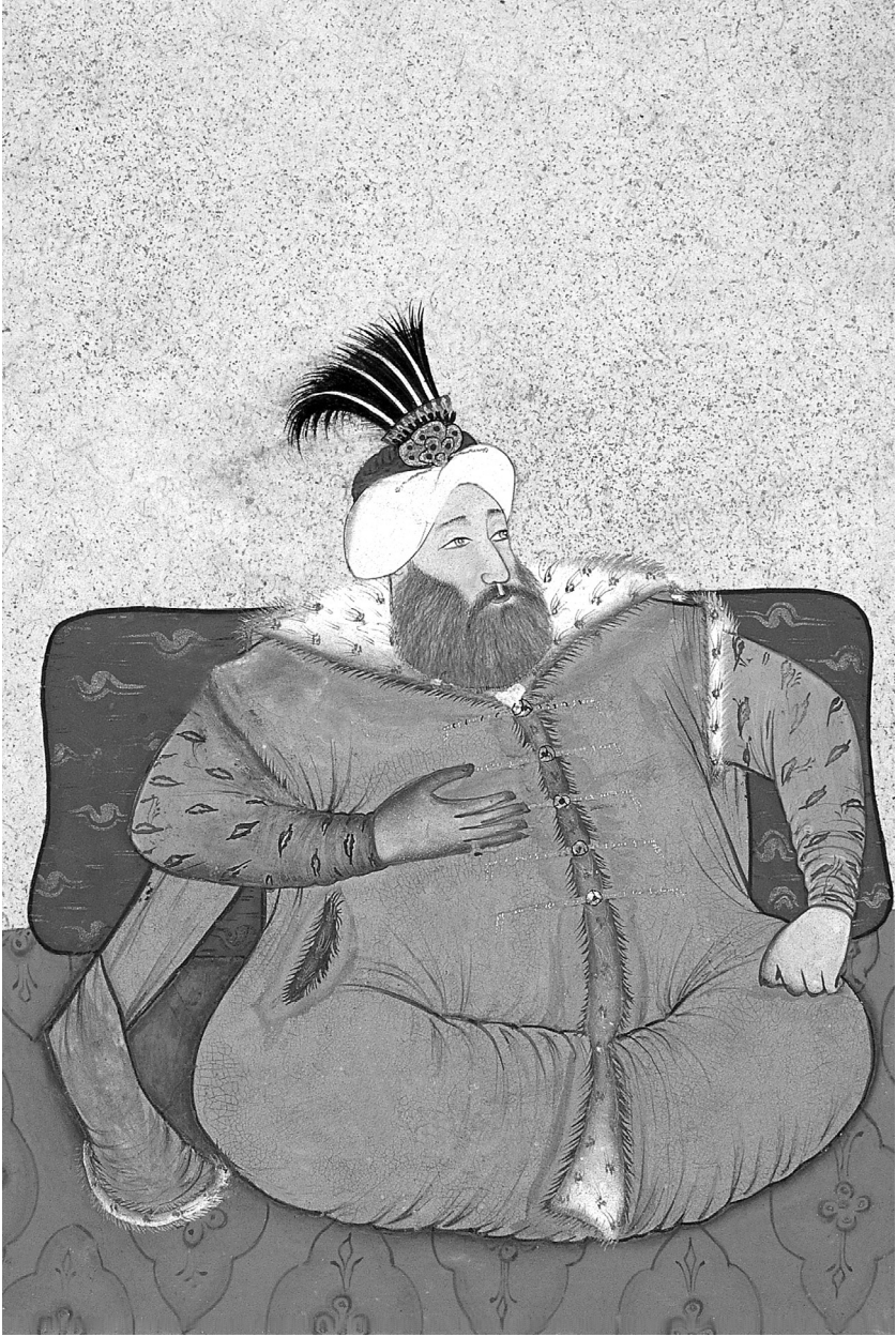
Sultan II. Süleyman

Köprülüzade sefere gittiği zaman İstanbul'un asayiş ve durumundan kesinlikle emin idi. Çünkü sadrazamlık kaymakamlığına amcazadesi Hüseyin Paşa'yı tayin etmişti. Sultan Süleyman sıhhatini bozmuş, sefe-