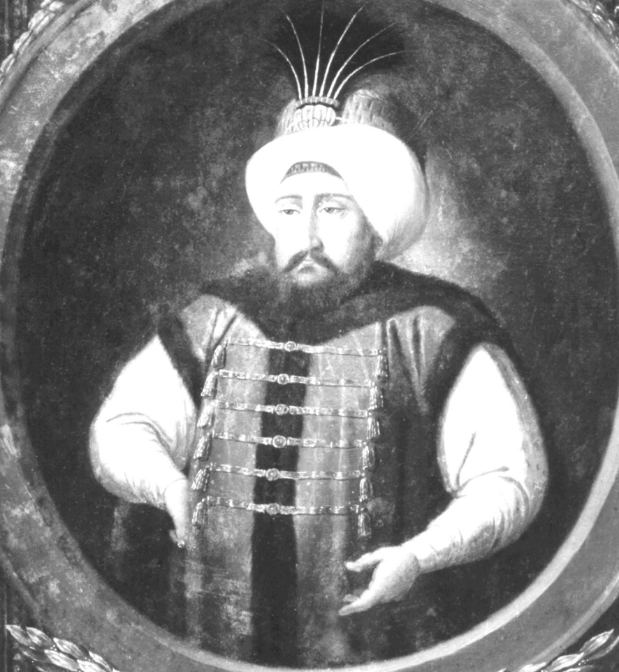
Sultan IV. Mehmed