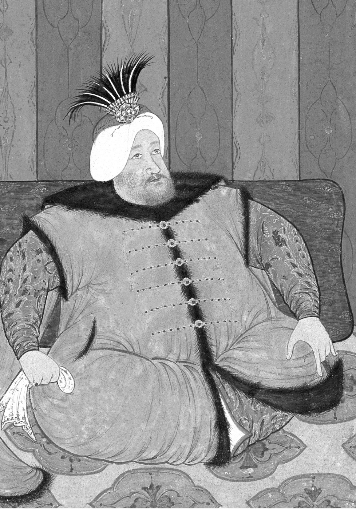
Sultan II. Mustafa