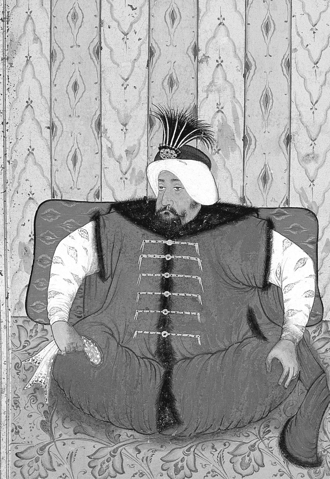
Sultan IV. Mehmed