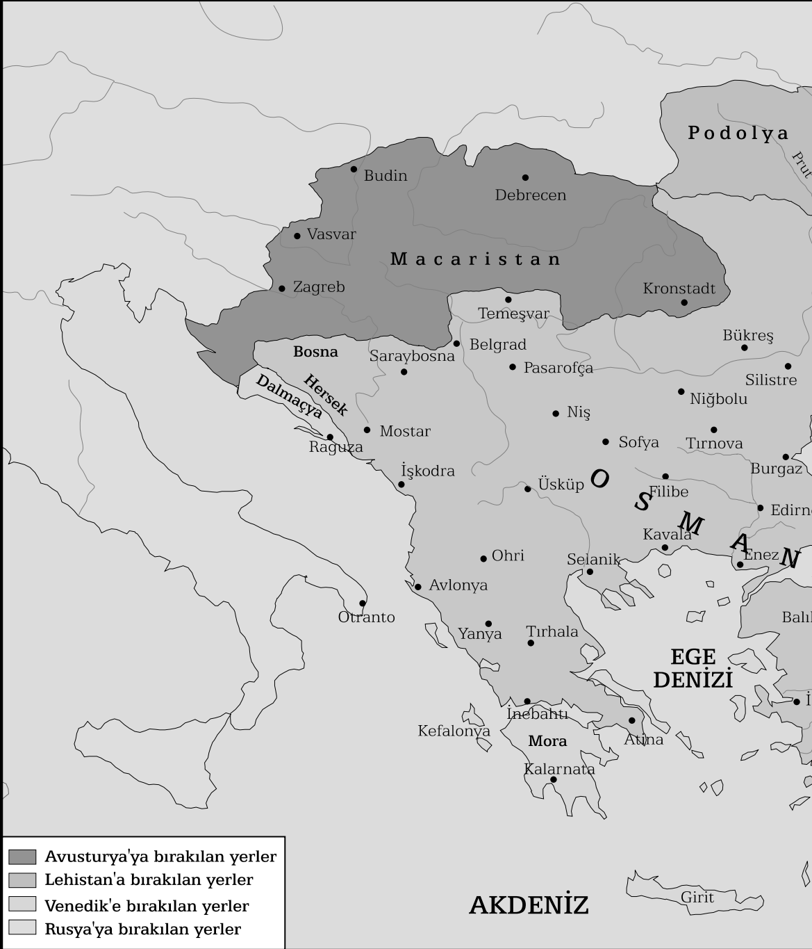
Karlofça ve İstanbul Antlaşmaları