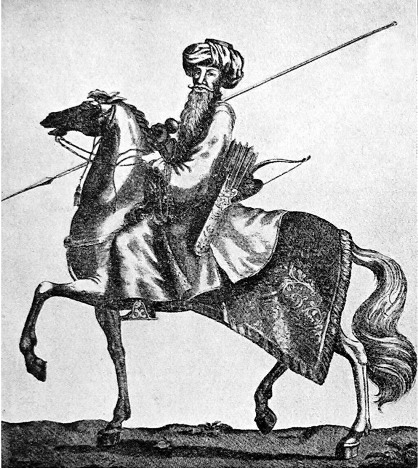
بودین قهرمانی عبدی پاشا ( او دوردہ یابیلمشدر )

Abdi Paşa (Eserin orijinalinden alınmıştır)