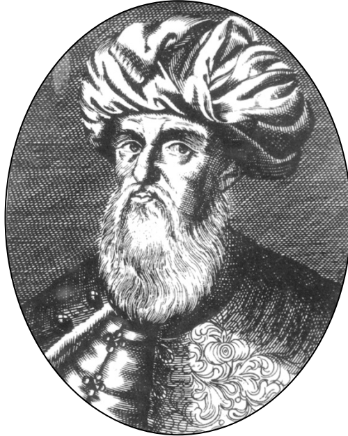
Merzifonlu Kara Mustafa Paşa'nın temsili bir gravürü

Kara Mustafa Paşa, ziynet ve ihtişama çok düşkündü. Konağına topladığı halk, ordu teşkil edecek derecede çoktu. İhtiyar Köprülü'nün ki-birli damadı on sekiz yaşında iken evlenmiş, sarayını süsleyen odalıklarının büyüleyici bakışları altında yaşamayı tercih etmişti. Kara Mustafa Paşa'nın dört odalığı vardı: Birinciden iki kızı ile bir oğlu, ikinciden bir kızı ile bir oğlu, üçüncüden yalnız bir kızı kalmış, dördüncüden hiç çocuğu dünyaya gelmemiştir. 3