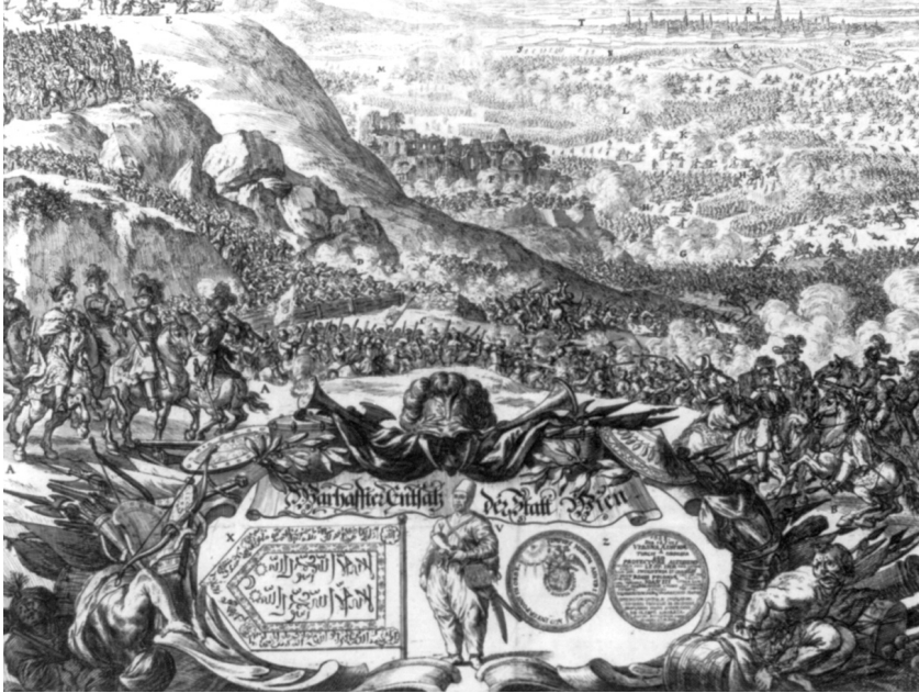
II. Viyana Bozgununu resmeden bir tablo

Sent Stefan (İstefani) Kilisesi'nin çanı ile işaretler veriliyor, şehirde tüccar, talebe, kadın, çoluk çocuk mahşerî bir heyecan meydana getiriyordu. Kara Mustafa Paşa'nın tuğları ve çadırları batıdan bütün şehri çeviriyor, diğer taraftan Tuna'nın kolları aşılması mümkün olmayan bir mâni teşkil ediyordu. Hilal'in Viyana önlerinde görülmesi Avrupa'da umumi bir heyecan meydana getirmişti. Hemen bütün dikkat nazarları Fransa'nın hâl ve hareketine çevrilmişti. Lehistan ve Bavyera imparatorla ittifak etmişlerdi. Yalnız Fransa, Hristiyanlığı kurtarmak hususunda ilgisiz kalmıştı. Bu vaziyet papayı endişelendiriyor, Osmanlıların yürüyüşünü haber alan XI. İnnosan, XIV. Lui'yi de yardıma çağırıyordu. Bu sıralarda papanın Fransa ile arası açıktı. Fakat Burgonya Dükü'nün doğumu papaya yeni bir zemin hazırlamış, tebrik için gönderilen murahhas, aynı zamanda Hristiyanlığın da tehlikede bulunduğunu anlatmıştı.